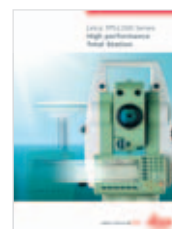
Leica TPS1200 Catálogo producto