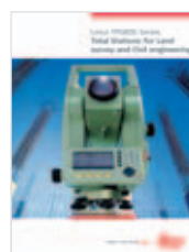
Leica TPS800 Catálogo producto