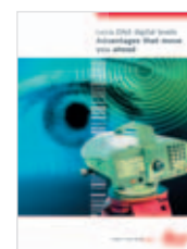
Leica DNA Catálogo producto