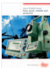
Leica TPS400 Catálogo producto

Los datos técnicos, las ilustraciones y descripciones no son vinculantes y pueden ser modificados. Impreso en Suiza – Copyright Leica Geosystems AG, Heerbrugg, Suiza, 2005. 725904es – 1.06 – RDV