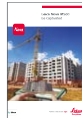
Leica Nova MS60