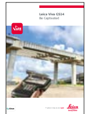
Leica Viva GS14